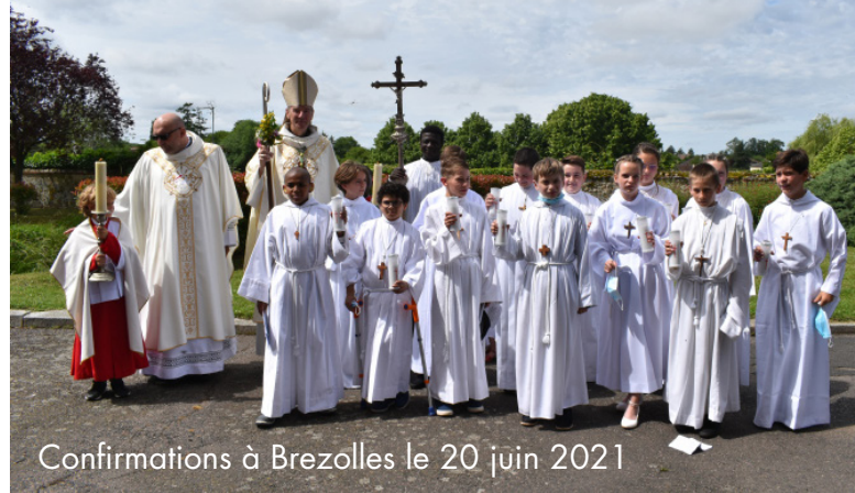
Confirmations à Brezolles le 20 juin 2021

La Confirmation, comme chaque sacrement, n'est pas l'œuvre des hommes, mais de Dieu, qui prend soin de notre vie de manière à nous façonner à l'image de son Fils, pour nous rendre capables d'aimer comme Lui. Il